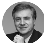
CRISTÓBAL LIRA Alcalde, Municipalidad de Lo Barnechea