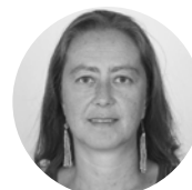
VERÓNICA KUNZE Subsecretaria de Turismo, Subsecretaria de Turismo